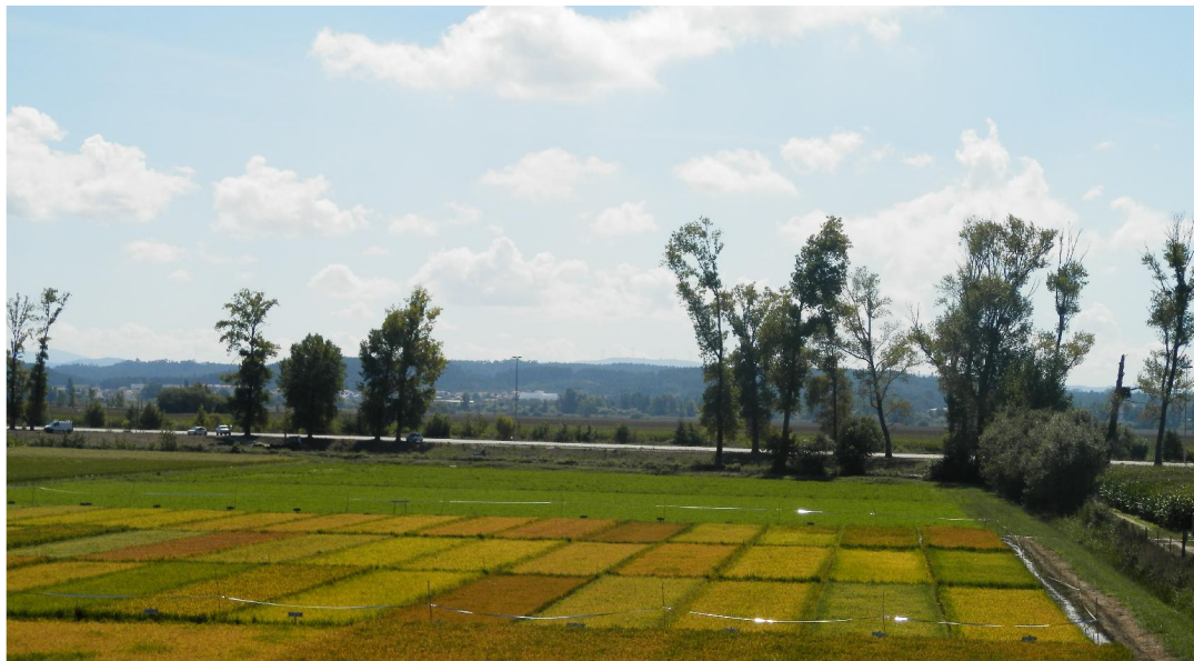
Fotografia 1 - Vista do Ensaio de Variedades de Arroz

O canteiro foi drenado em 3 fases, sendo a primeira após a germinação do arroz e as restantes ocorreram antes das aplicações dos herbicidas de pós-emergência.